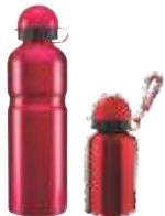
TAMAÑOS TMPS 101 Y TMPS 400

Bordados MONTERREY DESDE 1992 UNIFORMES INDUSTRIALES