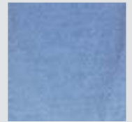
Cielo Jaspeado Light Blue Heather