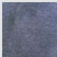
Marino Jaspeado Navy Heather