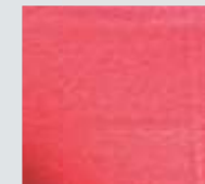
Rojo Jaspeado Red Heather