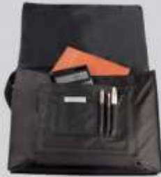
Incluye organizador con 8 compartimentos.