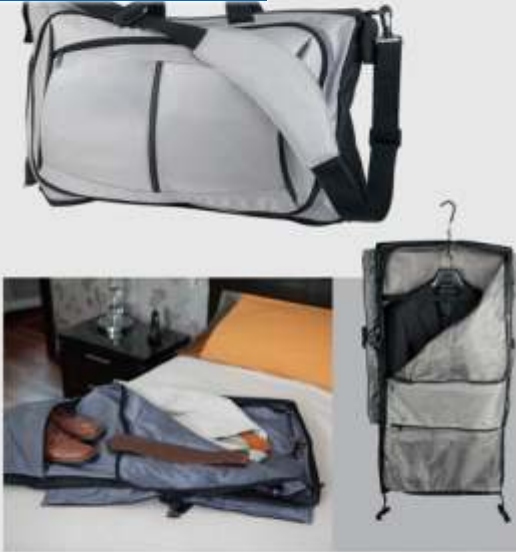
Bolsa frontal y posterior. Incluye espacio para trajes.

Materia: Poliéster / Nylon Medida: 38 x 33 x 11 cm Área de Impresión: 13 x 15 cm Técnica de Impresión: Bordado / Serigrafía Colores: Plata