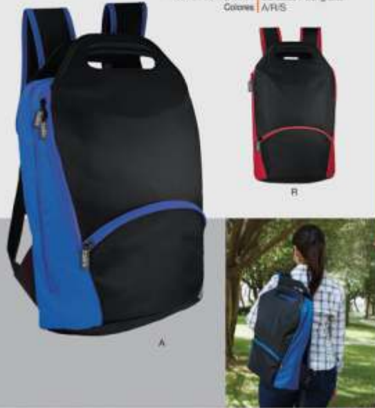
Incluye espacio para laptop y con compartimento interno. Bolsa interna con organizador y 4 compartimentos. Bolsa frontal.

Materia: Poliéster Medida: 32 x 48 x 10 cm Área de Impresión: 16 x 10 cm Técnica de Impresión: Bordado / Serigrafía Colores: A/R/S-