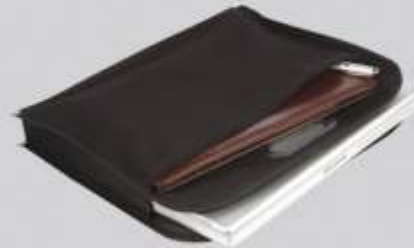
Espacio para documentos. Cierre frontal.