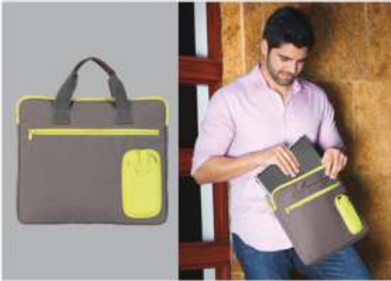
Portafolio con compartimento para laptop de 13", cierre frontal y adorno especial de silicona para celular.