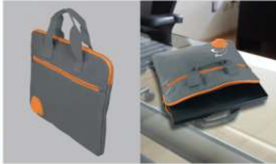
Incluye bolsa frontal. Bolsa principal para laptop de 13". Compartimento de silicona para audífonos.