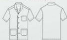
Bata corta con cuello sport. 3 bolsas de parche al frente. Espalda sin cintos. Botón visible.

Producto Nuevo BAISM0C060E21U Verde Militar 100% Poliéster (Botón Oculto) Peso: 174.66 gr/m 2