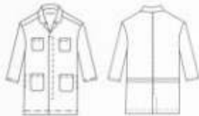
Bata 3/4, Botón Oculto

BAISTCBA3021U Verde Militar (Gasolinera) Peso: 280 gr/m 2 (Largo 3/4, 3 Bolsas de Parche, Botón Oculto)