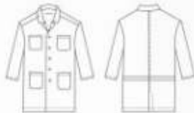
Bata larga con cuello sport. 4 bolsas de parche al frente, apertura lateral de cada lado. Botón visible.